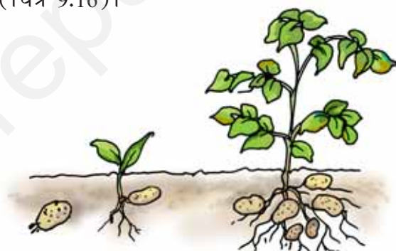
चित्र 9.16 आलू की सुप्त कलिका से उगता एक पौधा

कुछ पौधे बीज के अतिरिक्त अपने कायिक भागों द्वारा भी नए पौधे उत्पन्न करते हैं। उदाहरणतः आलू के कलिका वाले भाग से नया पौधा बनता है (चित्र 9.16)।