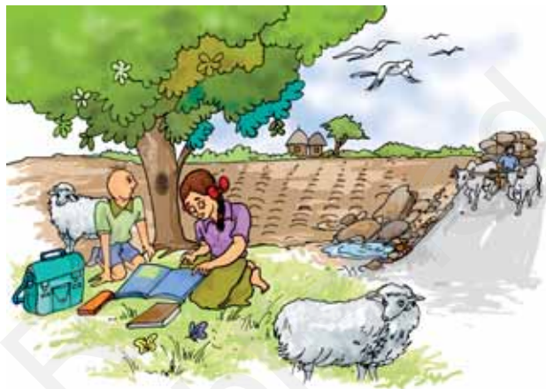
चित्र 9.1 सजीवों के लिए खोज

उन्होंने यह जानने की कोशिश की कि क्या पृथ्वी पर कोई ऐसा भी स्थान है, जहाँ कोई भी जीव नहीं पाया जाता। बूझो ने अपने घर के आस-पास के स्थानों का ध्यान किया। घर के अंदर उसने अलमारी एवं दरवाज़ों को देखा। उसने सोचा था कि इनमें कोई सजीव नहीं होगा, परंतु उसे एक छोटी-सी मकड़ी नज़र आई। घर से बाहर भी वह किसी ऐसे स्थान के बारे में नहीं सोच पाया जहाँ किसी न किसी प्रकार के जीव न पाए जाते हों (चित्र 9.1)। पहेली ने दूर-दूर के स्थानों के विषय में पढ़ना एवं सोचना प्रारंभ किया। उसे पता लगा कि लोगों ने तो ज्वालामुखी के मुख (मुहाने) में भी सूक्ष्म जीवों को खोज निकाला है।