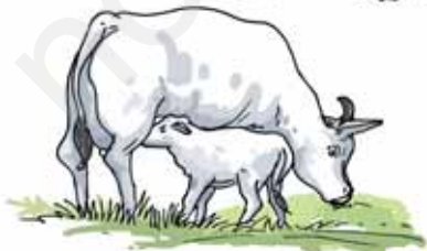
चित्र 9.14 बच्चे देने वाले कुछ जंतु

पौधे भी प्रजनन करते हैं? जंतुओं की तरह पौधों में भी प्रजनन के तरीके भिन्न-भिन्न हैं। बहुत-से पौधे बीजों द्वारा प्रजनन करते हैं। पौधे बीज उत्पादित करते हैं। हम उन्हें अंकुरित करके नए पौधे उगा सकते हैं (चित्र 9.15)।