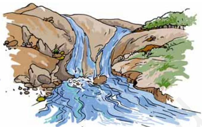
चित्र 14.8 वर्षा का जल झरनों और नदियों के रूप में बहता है

है। इनमें से कुछ जल की बूँदें इतनी भारी हो जाती हैं कि वे नीचे की ओर गिरने लगती हैं। इन गिरती हुई बूँदों को ही हम वर्षा कहते हैं। विशेष परिस्थितियों में यह ओले या हिम के रूप में भी गिर सकती है।