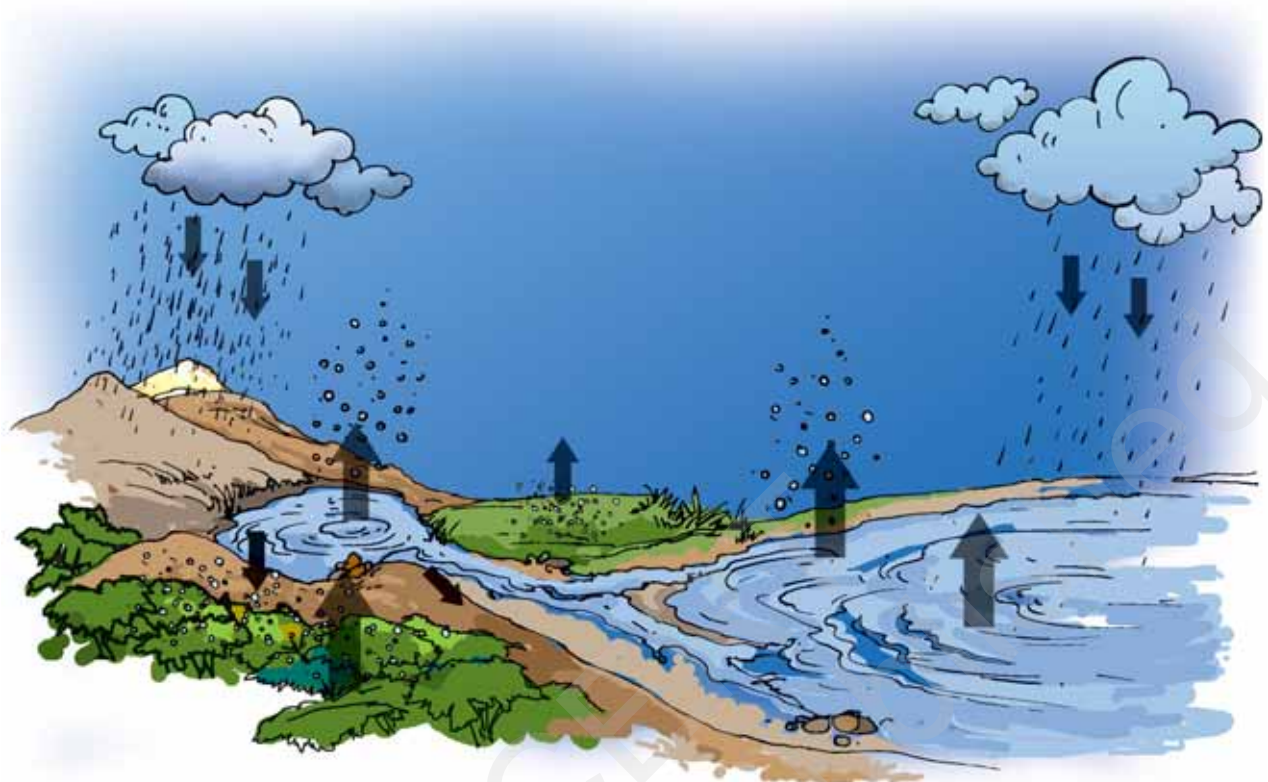
चित्र 14.9 जलचक्र

और अंत में वापस महासागरों में लौट जाता है। जल के इस प्रकार चक्रण करने को जलचक्र कहते हैं (चित्र 14.9)। समुद्र तथा भूमि के बीच यह जलचक्र एक निरंतर प्रक्रम है। यह भूमि पर जल की आपूर्ति बनाए रखता है।