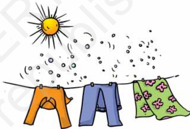
चित्र 14.4 अलगनी पर सूखते कपड़े

आपने कितनी बार यह देखा है कि फ़र्श पर फैला जल कुछ समय बाद सूख जाता है? यह जल विलुप्त होता प्रतीत होता है। इसी प्रकार गीले कपड़ों के सूखते समय भी जल विलुप्त हो जाता है (चित्र 14.4)। वर्षा के पश्चात् गीली सड़कों, छतों तथा अन्य स्थानों से भी जल विलुप्त हो जाता है। यह जल कहाँ चला जाता है?