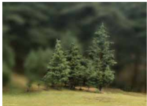
चित्र 9.6 पर्वतीय आवास के कुछ वृक्ष

पर्वतीय क्षेत्रों में पौधों एवं जंतुओं की अनेक प्रजातियाँ पाई जाती हैं। क्या आपने चित्र 9.6 में दर्शाए गए वृक्ष देखे हैं?