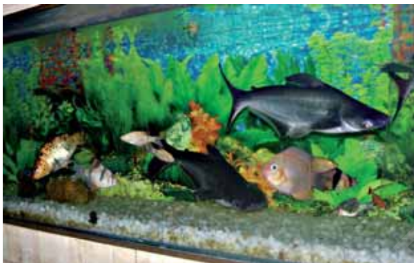
चित्र 9.3 विभिन्न प्रकार की मछलियाँ

में रहने योग्य बनाती है। ऊँट के पैर लंबे होते हैं जिससे उसका शरीर रेत की गरमी से दूर रहता है (चित्र 9.2)। उनमें मूत्रोत्सर्जन की मात्रा बहुत कम होती है तथा मल शुष्क होता है। उन्हें पसीना (स्वेद) भी नहीं आता क्योंकि शरीर से जल का ह्रास बहुत कम होता है। इसलिए जल के बिना भी वे अनेक दिनों तक रह सकते हैं।