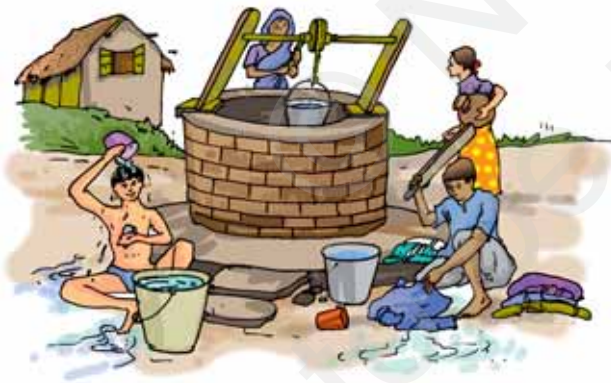
चित्र 14.1 पानी के उपयोग

पीने के अतिरिक्त ऐसे बहुत-से क्रियाकलाप हैं, जिनके लिए हम जल का उपयोग करते हैं (चित्र 14.1)। क्या आपको यह अनुमान है कि हम एक दिन में जल की लगभग कितनी मात्रा का उपयोग करते हैं?