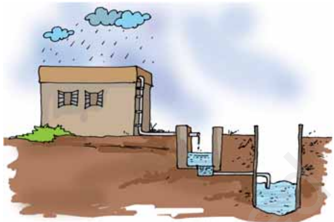
चित्र 14.11 छत पर वर्षा जल संग्रहण

जल में, छत पर उपस्थित मिट्टी के कण हो सकते हैं जिन्हें उपयोग करने से पहले निस्यंदित करना आवश्यक होता है। इस जल को भंडारण टैंक में एकत्रित करने के स्थान पर सीधे ही पाइपों द्वारा जमीन में बने किसी गड्ढे तक ले जाया जा सकता है जहाँ से यह मिट्टी में रिसाव द्वारा भौम-जल की पुनः पूर्ति करेगा (चित्र 14.11)।