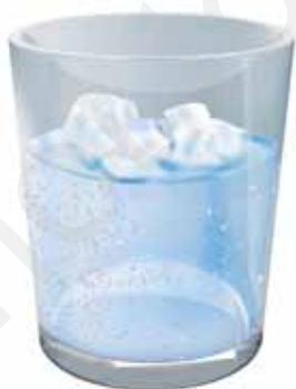
चित्र 14.6 बर्फ व जल से भरे गिलास के बाहरी पृष्ठ पर प्रकट जल की बूँदें

गिलास की बाहरी सतह पर जल की बूँदें कहाँ से आती हैं। बर्फयुक्त जल से भरे गिलास की बाहरी सतह, बाहर की हवा को ठंडा कर देती है और जलवाष्प गिलास की सतह पर संघनित हो जाती है। संघनन के इस प्रक्रम को हमने अध्याय 5 के क्रियाकलाप 7 में देखा था।