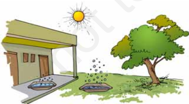
चित्र 14.5 सूर्य के प्रकाश (धूप) और छाया में जल का वाष्पन

दिन के समय सूर्य की किरणें महासागरों, नदियों, झीलों तथा तालाबों में भरे जल पर पड़ती है। खेत तथा अन्य भूमिक्षेत्र भी सूर्य की किरणों को ग्रहण करते हैं। इसके फलस्वरूप इन सभी का जल, निरंतर वाष्प में परिवर्तित होता रहता है। तथापि जल में घुले लवण शेष रह जाते हैं।