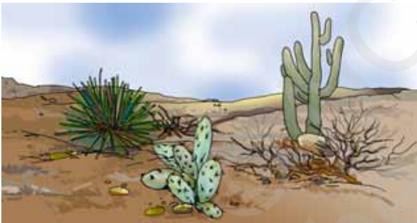
चित्र 9.5 मरुस्थल में उगने वाले कुछ पौधे

मरुस्थल में रहने वाले चूहे एवं साँप के, ऊँट की भाँति लंबे पैर नहीं होते। दिन की तेज़ गरमी से बचने के लिए वे भूमि के अंदर गहरे बिलों में रहते हैं (चित्र 9.4)। रात्रि के समय जब तापमान में कमी आती है, तो ये जंतु बाहर निकलते हैं।