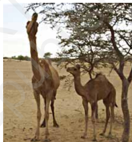
चित्र 9.2 ऊँट एवं उनका परिवेश

मरुस्थल में जल बहुत कम मात्रा में उपलब्ध होता है। मरुस्थल दिन में बहुत गरम एवं रात में ठंडा होता है। मरुस्थल में पाए जाने वाले पौधे एवं जंतु भूमि पर रहते हैं एवं श्वसन के लिए आस-पास की वायु का उपयोग करते हैं।