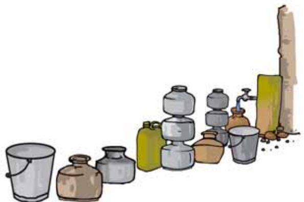
चित्र 14.12 जल एकत्र करने के लिए लंबी कतार

जल की माँग प्रतिदिन बढ़ रही है। जनसंख्या वृद्धि के साथ-साथ जल का उपयोग करने वाले लोगों की संख्या भी बढ़ रही है। बहुत-से नगरों में जल भरने के लिए लंबी कतारों का दिखना एक साधारण दृश्य है (चित्र 14.12)। खाने की वस्तुओं के उत्पादन और उद्योगों में भी जल की अधिकाधिक मात्रा का प्रयोग हो रहा है। इन्हीं कारणों से संसार के बहुत-से भागों में जल की कमी हो गई है। इसलिए यह आवश्यक है कि जल का विवेकपूर्ण उपयोग किया जाए। हम सावधानी बरतें, जिससे जल व्यर्थ न हो।