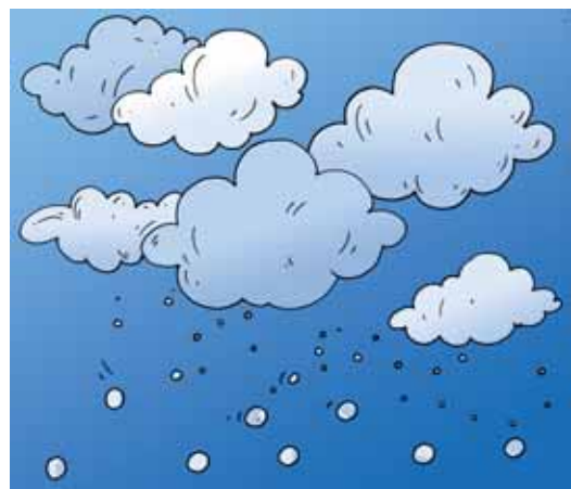
चित्र 14.7 बादल

इस प्रकार बनी हुई बहुत-सी जलकणिकाएँ आपस में मिलकर एक बड़े आमाप की जल की बूँदें बनाती