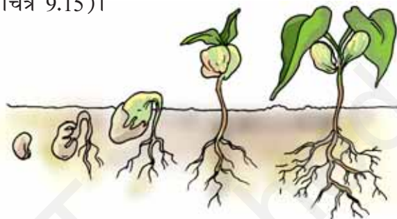
चित्र 9.15 एक पौधे का बीज अंकुरित होकर नया पौधा बनता है

पौधे भी प्रजनन करते हैं? जंतुओं की तरह पौधों में भी प्रजनन के तरीके भिन्न-भिन्न हैं। बहुत-से पौधे बीजों द्वारा प्रजनन करते हैं। पौधे बीज उत्पादित करते हैं। हम उन्हें अंकुरित करके नए पौधे उगा सकते हैं (चित्र 9.15)।