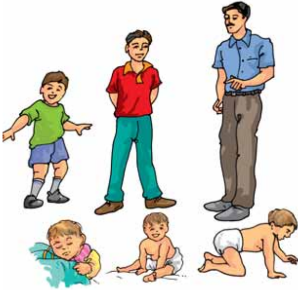
चित्र 9.10 एक शिशु वृद्धि करके वयस्क हो जाता है

हो जाते हैं। एक अंडे से स्फुटित होकर चूजा (मुर्गी का बच्चा) वृद्धि करके मुर्गी अथवा मुर्गा में परिवर्तित हो जाता है (चित्र 9.11)।