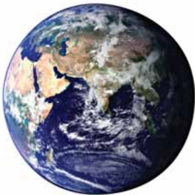
14.3 महासागरों ने पृथ्वी के अधिकतर भाग को घेर रखा है

क्या आप जानते हैं कि पृथ्वी का 2/3 भाग जल से घिरा हुआ है? इस जल का अधिकांश भाग समुद्रों और महासागरों में है (चित्र 14.3)।