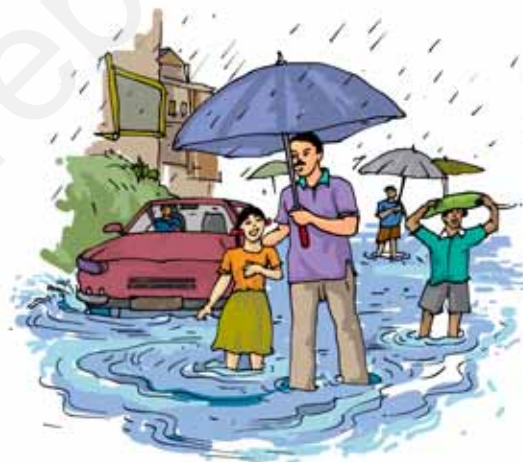
चित्र 14.10 भारी वर्षा के बाद का दृश्य

परंतु अत्यधिक वर्षा से बहुत-सी समस्याएँ उत्पन्न हो सकती हैं (चित्र 14.10)। भारी वर्षा से नदियों,