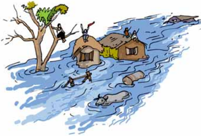
चित्र 14.11 किसी बाढ़ग्रस्त क्षेत्र का दृश्य

बाढ़ के समय जल में रहने वाले जीव भी बह जाते हैं। प्रायः जब बाढ़ का जल उतरता है तो ये जलशय जीव, थल भाग में फंसकर मर जाते हैं। वर्षा भूमि पर रहने वाले जीवों को भी प्रभावित करती है।