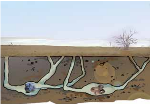
चित्र 9.4 बिल में मरुस्थलीय जंतु

मरुस्थल में रहने वाले चूहे एवं साँप के, ऊँट की भाँति लंबे पैर नहीं होते। दिन की तेज़ गरमी से बचने के लिए वे भूमि के अंदर गहरे बिलों में रहते हैं (चित्र 9.4)। रात्रि के समय जब तापमान में कमी आती है, तो ये जंतु बाहर निकलते हैं।