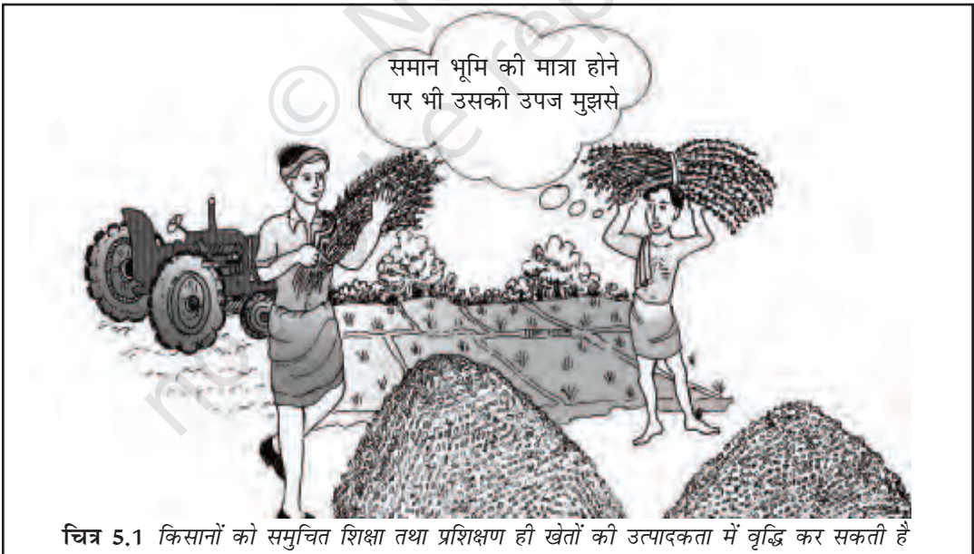
चित्र 5.1 किसानों को समुचित शिक्षा तथा प्रशिक्षण ही खेतों की उत्पादकता में वृद्धि कर सकती है

आर्थिक समृद्धि में उसका योगदान क्रमशः अधिक होता है। शिक्षा पाने का प्रयास केवल उपार्जन क्षमता बढ़ाने के लिए नहीं किया जाता बल्कि उसके और भी अधिक मूल्यवान लाभ हैं। शिक्षा लोगों को उच्चतम सामाजिक स्थिति और गौरव प्रदान करती है। यह किसी व्यक्ति को अपने जीवन में बेहतर विकल्पों का चयन कर पाने के योग्य बनाता है, व्यक्ति को समाज में चल रहे परिवर्तनों की बेहतर समझ प्रदान करता है और नव परिवर्तनों को बढ़ावा देता है। शिक्षित श्रम शक्ति की उपलब्धता नयी प्रौद्योगिकी को अपनाने में भी सहायक होती है। देश शिक्षा के अवसरों