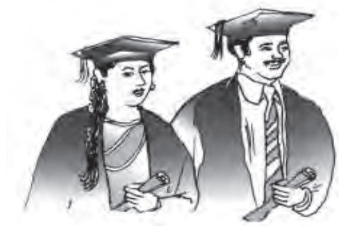
चित्र 5.7 उच्च शिक्षा: कम प्राप्तकर्ता

उच्च शिक्षा-लेने वालों की कमी: भारत में शिक्षा का पिरामिड बहुत ही नुकीला है, जो दर्शाता है कि उच्चतर शिक्षा स्तर तक बहुत