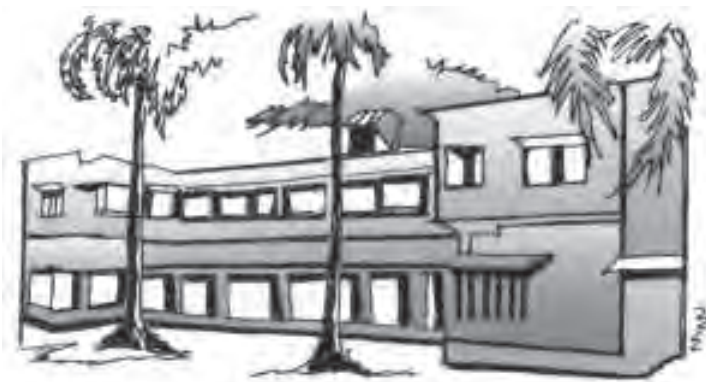
चित्र 5.5 शैक्षिक आधारिक संरचनाओं में निवेश अपरिहार्य

के शैक्षिक व्यय को शामिल कर लें तो शिक्षा पर कुल व्यय और अधिक होना चाहिए। कुल शिक्षा व्यय का एक बहुत बड़ा हिस्सा प्राथमिक शिक्षा पर खर्च होता है। उच्चतर/तृतीयक शैक्षिक संस्थाओं (उच्च शिक्षा के संस्थानों जैसे-महाविद्यालयों, बहुतकनीकी संस्थानों और विश्वविद्यालयों आदि) पर होने वाला व्यय सबसे कम है। यद्यपि औसत रूप से सरकार उच्चतर शिक्षा पर बहुत कम व्यय करती है, किंतु प्रति विद्यार्थी उच्चतर शिक्षा पर व्यय प्राथमिक शिक्षा की तुलना में अधिक है। इसका, अर्थ यह नहीं है कि वित्तीय संसाधनों को उच्चतर शिक्षा से प्राथमिक शिक्षा की ओर कर दिया जाना चाहिए।