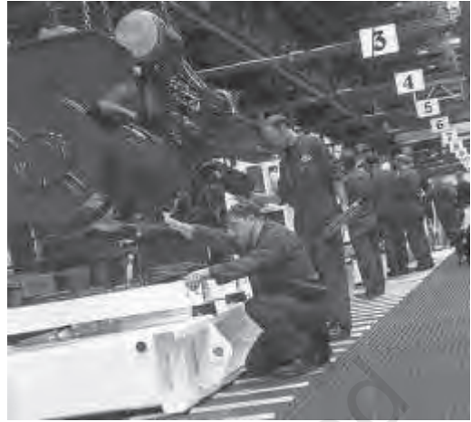
चित्र 5.3 वैज्ञानिक और तकनीकी जन-शक्ति: मानव पूँजी का एक मुख्य घटक है

मानव पूँजी की वृद्धि के कारण आर्थिक संवृद्धि होती है। इसे सिद्ध करने के लिए व्यावहारिक साक्ष्य अभी स्पष्ट नहीं हैं। इसका कारण मापन की समस्याएँ हो सकती हैं। उदाहरण के लिए, स्कूली वर्षों की गणना, शिक्षक-शिक्षार्थी अनुपात और नामांकन दर आदि के आधार पर शिक्षा का मापन उसकी गुणवत्ता को आर्थिक रूप से व्यक्त नहीं कर पाता। इसी प्रकार स्वास्थ्य सेवाओं पर मौद्रिक व्यय, जीवन प्रत्याशा तथा मृत्यु दरों आदि से देश की जनसंख्या के वास्तविक स्वास्थ्य स्तर का सही ज्ञान नहीं होता। यदि इन सूचकों का प्रयोग कर विकसित तथा विकासशील देशों में शिक्षा व स्वास्थ्य स्तरों और प्रतिव्यक्ति आय में सुधारों की तुलना करें तो हमें मानव पूँजी के परिवर्तनों में साहचर्य दिखायी पड़ता है, किंतु प्रतिव्यक्ति वास्तविक आय में ऐसी कोई प्रवृत्ति स्पष्ट नहीं होती। दूसरे