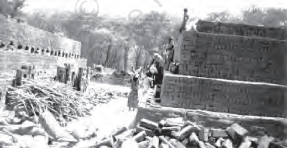
चित्र 5.6 विद्यालय छोड़ने वाले छात्र बाल श्रम को बढ़ावा देते हैं जिससे मानव पूँजी का क्षय होता है

कम लोग पहुँच पाते हैं। यही नहीं, शिक्षित युवाओं की बेरोजगारी दर भी उच्चतम है। राष्ट्रीय प्रतिदर्श सर्वेक्षण संगठन के आंकड़ों के अनुसार, वर्ष 2011-12 में ग्रामीण क्षेत्रों में स्नातक व ऊपर अध्ययन किया हो युवा पुरुषों के बीच बेरोजगारी दर 19 प्रतिशत थी। उनके शहरी समकक्षों में 16 प्रतिशत अपेक्षाकृत कम स्तर पर बेरोजगारी दर थी। सबसे गंभीर रूप से प्रभावित लोगों में लगभग 30 प्रतिशत बेरोजगार हैं जो युवा ग्रामीण महिला थीं। इसके