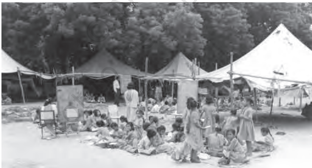
चित्र 5.2 मानव पूँजी निर्माण: दिल्ली में अस्थाई रूप से चल रहा एक विद्यालय

राष्ट्रीय आय में वृद्धि से होता है तो फिर स्वाभाविक ही है कि किसी शिक्षित व्यक्ति का योगदान अशिक्षित की तुलना में कहीं अधिक होगा। एक स्वस्थ व्यक्ति अधिक समय तक व्यवधानरहित श्रम की पूर्ति कर सकता है।