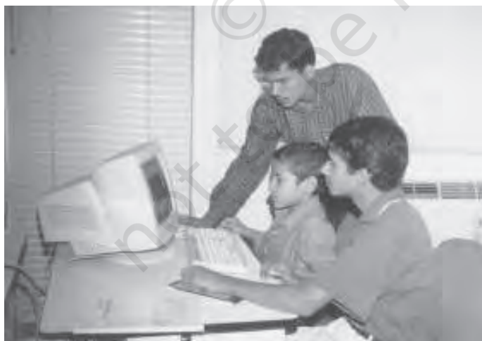
चित्र 5.4 आगे का काम: भारत को ज्ञान अर्थव्यवस्था में परिवर्तित करना

विश्व बैंक ने अपनी एक ताजा रिपोर्ट ‘भारत और ज्ञान